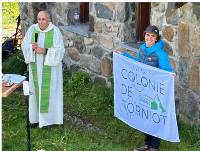
LA BÉNÉDICTION DU NOUVEAU DRAPEAU