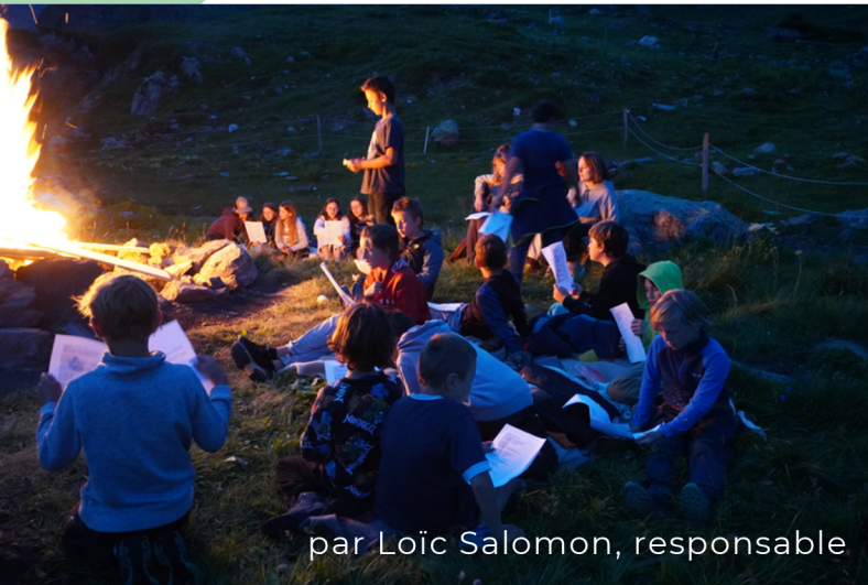
par Loïc Salomon, responsable