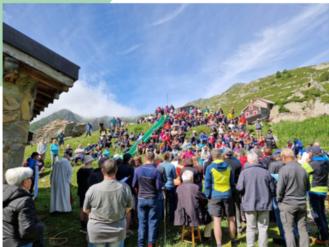
UNE MESSE POUR ANCRER LA JOURNÉE