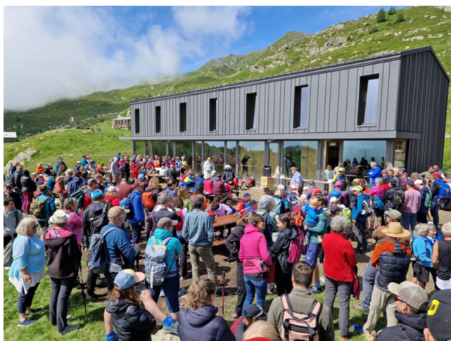
UN BEAU RASSEMBLEMENT POPULAIRE